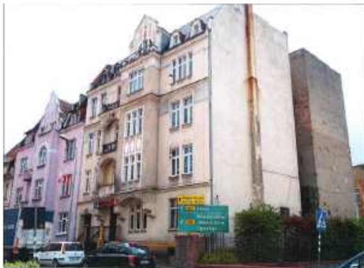
Widok elewacji frontowej – ul. Bankowa 9.

na sprzedaż lokalu mieszkalnego Nr 8, znajdującego się w budynku położonym w Lubaniu przy ul. Bankowej 9 wraz z udziałem we współwłasności nieruchomości gruntowej (działka nr 49, AM 4, Obręb III o powierzchni 345 m 2 , JG1L/00016293/5)